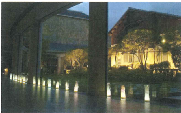
子供たちが作ったランプシェードの光に浮かび上がる美術館