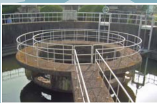
疎水の分水施設(西区)