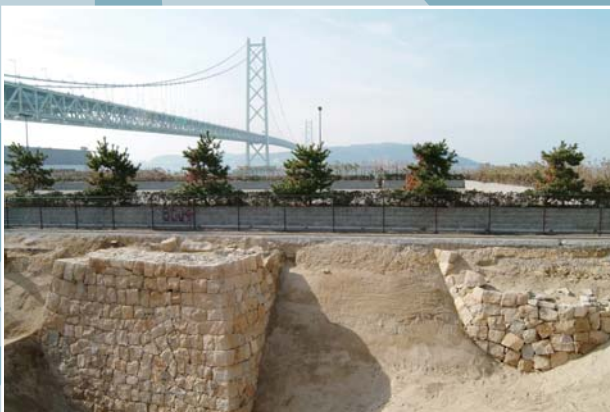
明石藩舞子台場跡(垂水区)