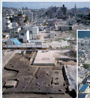
震災直後の復興調査 左：本山遺跡(東灘区) 右：上沢遺跡(長田区)

平成7年1月17日に発生した兵庫県南部地震は、甚大な被害をもたらした阪神・淡路大震災を引き起こしました。令和2年1月17日、震災から25年という節目を迎えます。被災した遺跡や復興事業に伴う埋蔵文化財発掘調査の記録写真を通して被災から復興までの道のりをたどり、震災復興と埋蔵文化財保護の両立という視点から見た阪神・淡路大震災を振り返ります。