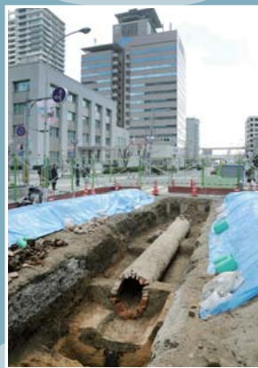
明治時代のレンガ下水道(中央区)