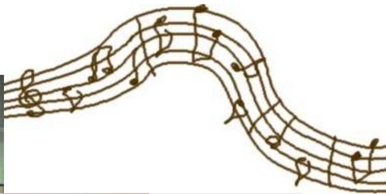
ホルン リハーサル