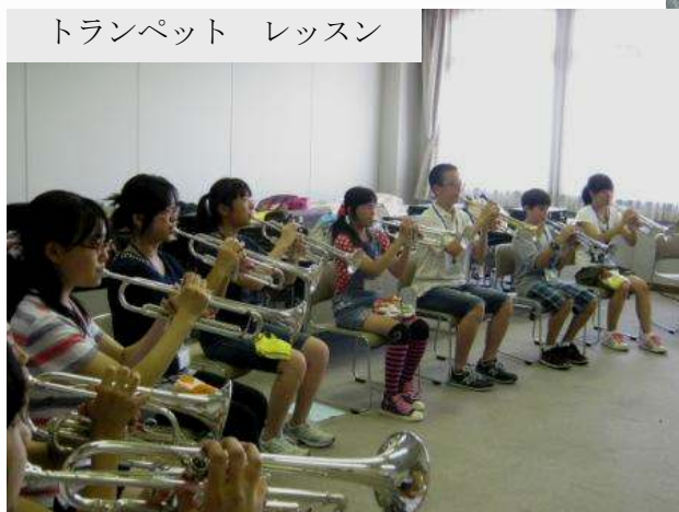
トランペット レッスン