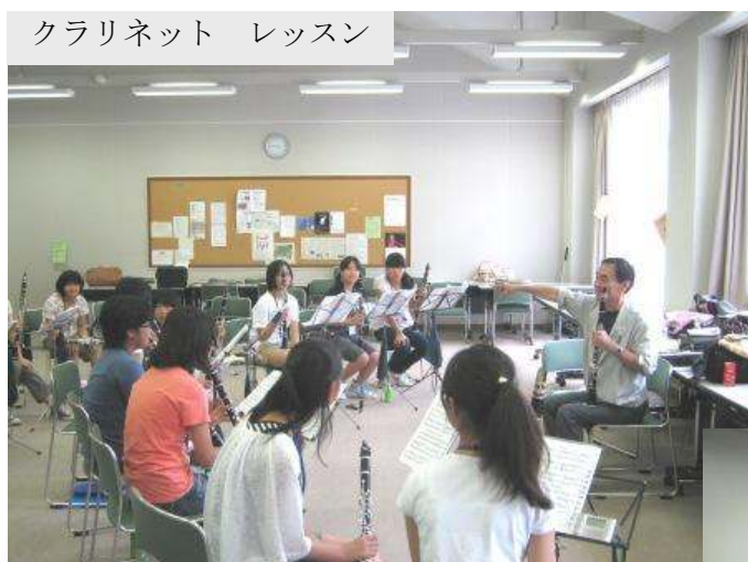
クラリネット レッスン