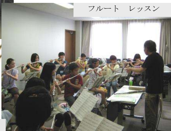
フルート レッスン