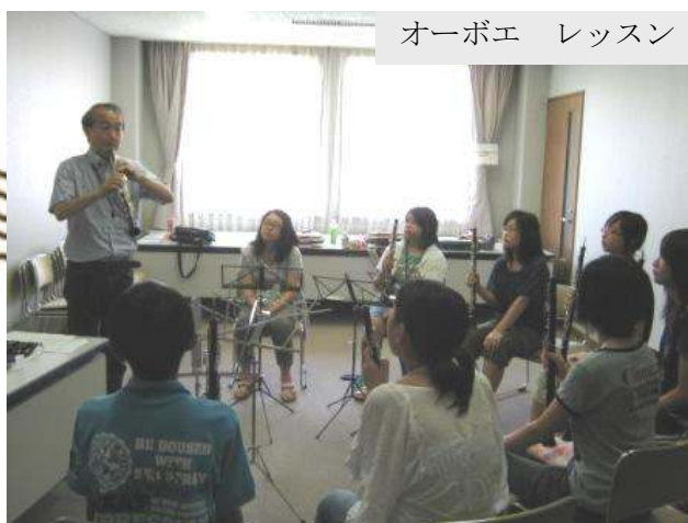
オーボエ レッスン