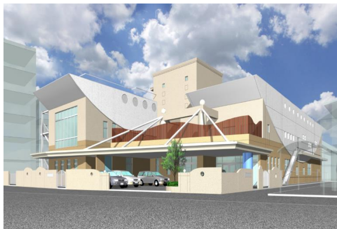
写真：連携施設(仮称)「幼保連携型認定こども園村雨こども園」