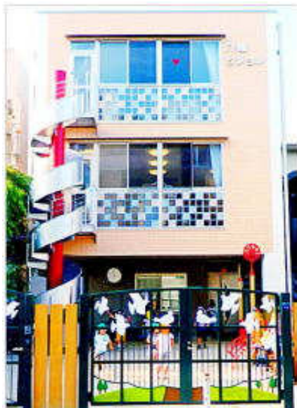
JR六甲道駅より東へ徒歩5分 八幡幼稚園の東側に隣接

〒657-0038 神戸市灘区深田町1丁目1-2 TEL : 079-862-1330 FAX : 078-842-6706