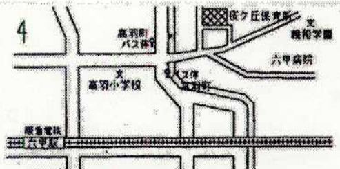
(市バス16系統高羽町から徒歩3分)

定期健康診断は春・秋年2回、歯科検診は年1回(4・5歳児のみ2回)嘱託医により行います。4・5歳児は、眼科健診・耳鼻科健診を年1回、検診医により行います。また、尿検査・ぎょう虫検査も行います。