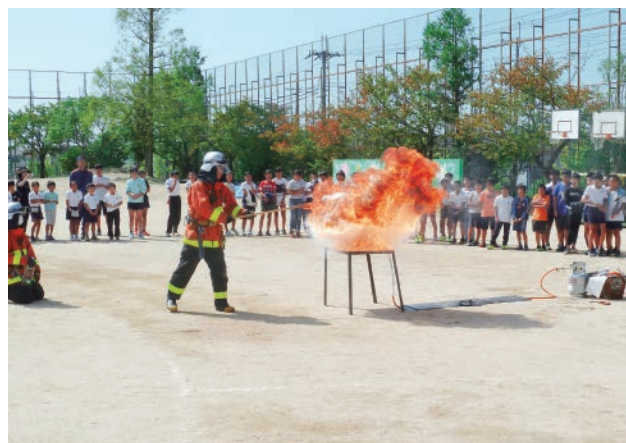
▲防災福祉コミュニティや関係機関と連携して行われる防災体験学習

阪神・淡路大震災という未曾有の災害を乗り越えていく過程で学んだ教訓を学校教育の中で生かし、未来に向かって力強く生きていく子供の育成を図っていくことをねらいとして、多くの学校で地域団体や関連機関と連携した防災体験学習や避難訓練を実施しています。また、追悼行事や、教職員が震災当時の思いを曲にした「しあわせはこべるように」を子供たちが歌い継ぐ等、各学校で防災教育の実践を行っています。