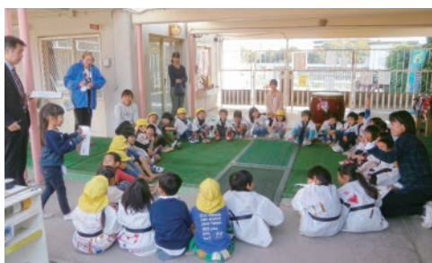
▲今日の活動の振り返り(5歳児)