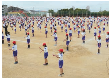
▲全校生リズム縄跳び