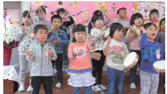
▲「サンタさんも聴いてくれているかな」

たくさんの方に支えられて、子供たちは元気いっぱい過ごすことができます。これからも、人とのつながりを大切に、何事にも力いっぱい取り組む子供を育てていきたいと思えます。