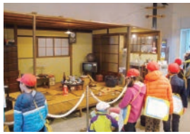
▲展示会を見学する小学生

そんな「昭和」をテーマにしたちょっと昔の歴史を、生活に浸透するさまざまな電化製品や、子供たちが夢中になったおもちゃの数々などの昭和の「もの」で探ります。会期中にはさまざまなイベントも開催します。