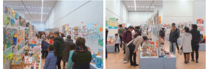
▲第17回神戸っ子アートフェスティバル会場風景