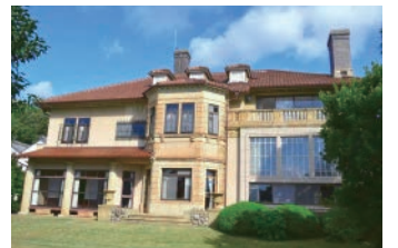
▲見学先(予定)の旧乾邸(東灘区)