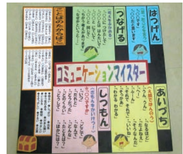
▲話し合い活動の手立て