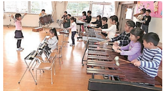
▲「指揮するから、みんな見てね」