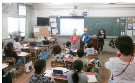
▲国語「お手紙」の音読(2年生)