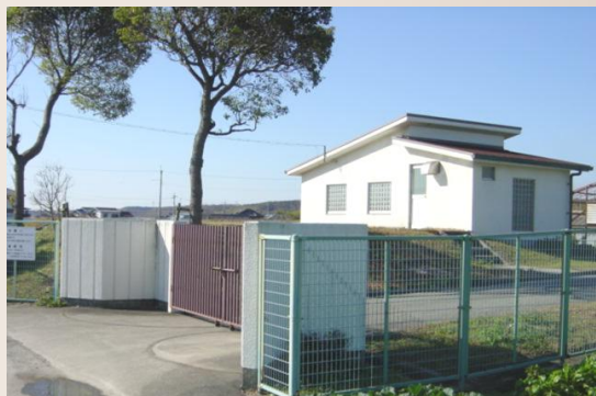
景観に配慮した集落排水処理施設