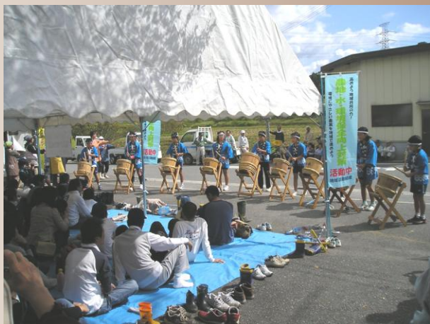
都市と農村との交流