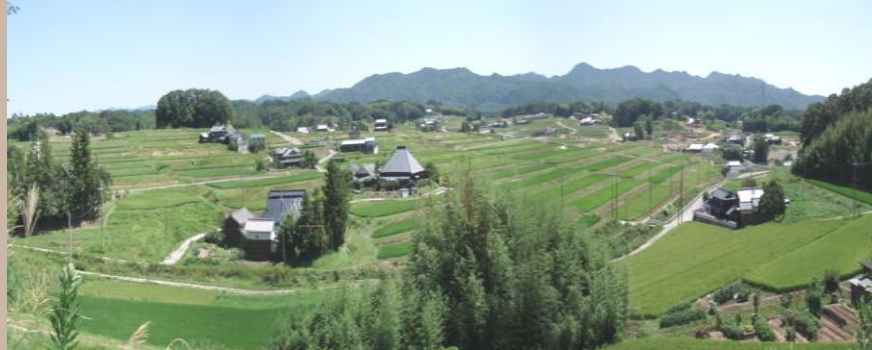
田んぼなどを整形する基盤整備事業